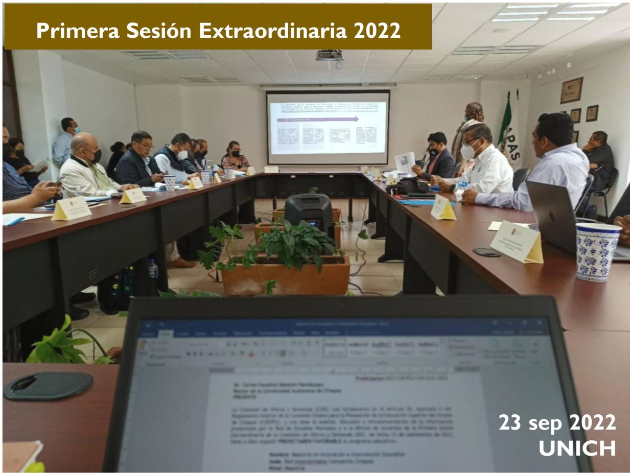
Primera Sesión Extraordinaria 2022